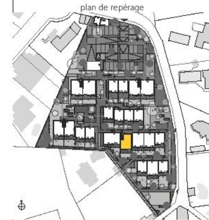
Logement E.016 - Type 2 - RDC 122, chemin des Amaryllis Marseille 13012